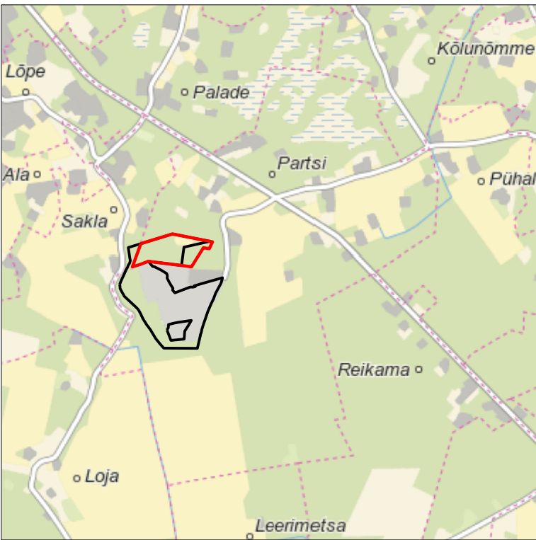
Kaardileht nr 6214 Kärkla